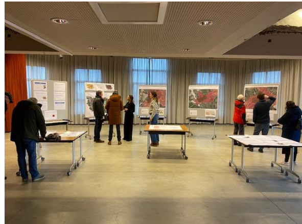
Beelden van de opstelling van de infomarkt