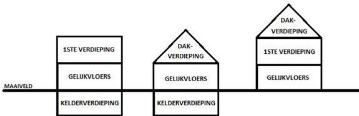
figuur 3: maximaal toegelaten gabarit