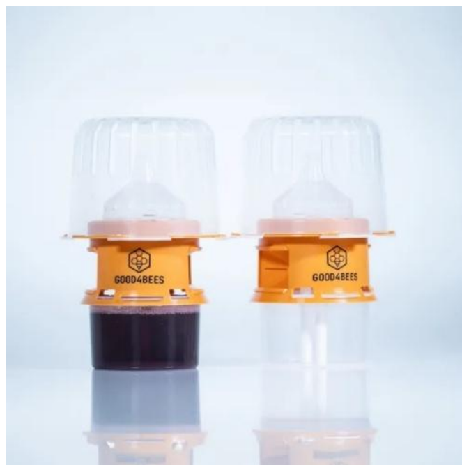
Good4Bees selectieve val

De val is selectief ontworpen en is groot genoeg om koninginnen van de Aziatische hoornaar te vangen, maar te klein voor koninginnen van de Europese hoornaar. Honingbijen en kleinere insecten kunnen bovendien eenvoudig ontsnappen. Het lokmiddel is veilig afgeschermd, waardoor er geen risico op verdrinking bestaat voor nuttige insecten.