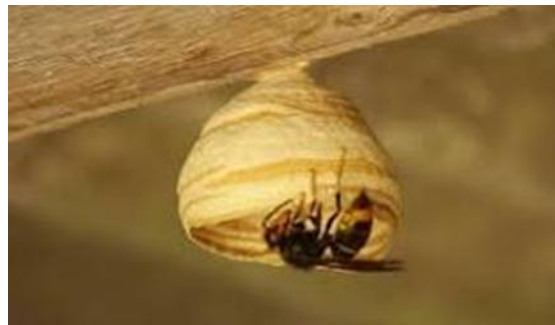
Embryonest Aziatische hoornaar

Embryonest: de bevruchte koningin ontwaakt uit een winterslaap. Haar eerste taak bestaat uit het maken van een klein embryonest op een beschutte plaats om eitjes in te leggen. De koningin staat in voor het grootbrengen en het verzorgen van de resulterende larven tot ze volwassen zijn. Vanaf begin mei vliegen de eerste volwassen werksters uit, dit zijn vrouwelijke hoornaars die de kolonie verder uitbouwen.