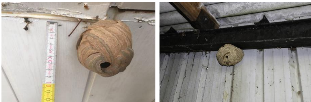
Links een jong primair nest (diameter 8 cm). Rechts een verder ontwikkeld primair nest.

Primair nest: het embryonest groeit uit tot een primair nest dankzij de hulp van de vele werksters. De koningin verlaat het nest niet meer. De kolonie heeft nu vooral meer nood aan eiwitten dan aan suikers. Dit nest is vaak niet groter dan een tennisbal, maar kan geleidelijk aan voetbalproporties aannemen. Deze nesten worden dicht bij de grond of maximaal op enkele meters hoogte gebouwd in struiken of hagen maar ook in schuren, onder afdaken ... Deze nesten hebben de grootste impact naar potentieel streekgevaar, maar zijn ook het eenvoudigst te bestrijden.