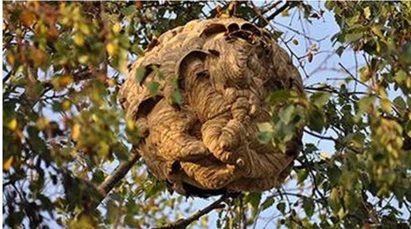
Secundair nest Aziatische hoornaar