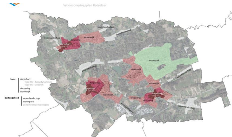
F.57-60 verduidelijken verder:

Deze zones staan weergegeven op een zoneringsplan (pagina 41 van de BGO):